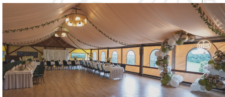
Zapytaj też o ofertę na namiot bankietowy

Minimalna liczba osób, dotyczy osób pełnoletnich (powyżej 10 roku życia). Maksymalna liczba osób, stanowi maksymalną liczbę miejsc (łącznie z dziećmi).