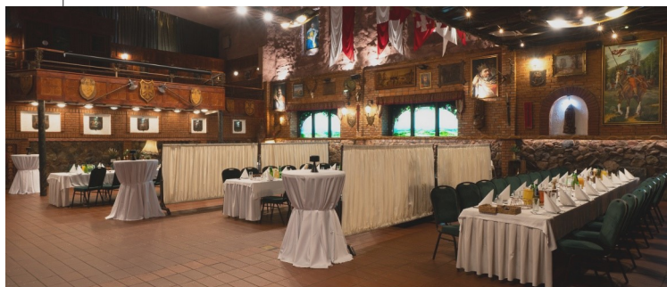
SALA RYCERSKA / stolik 15-40 os. / od 80 os.

W ramach niniejszej oferty proponujemy 4 indywidualne sale bankietowe oraz przestronną salę Rycerską, w której jednocześnie odbywa się do 5 przyjęć.