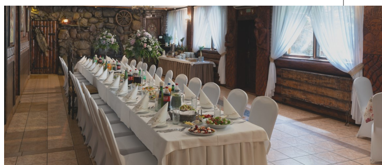
SALA PORTRETOWA / 20-40 os.