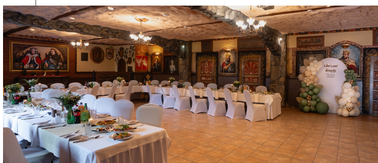
SALA KSIĄŻĘCA / 40-90 os.