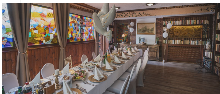
SALA SZLACHECKA / 15-22os.