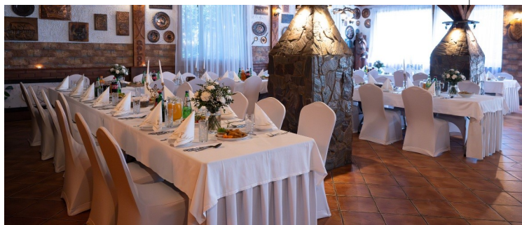
SALA MYŚLIWSKA / 35-75 os.